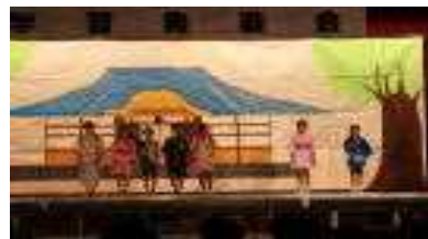
4年「ハートフル落語」