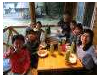
おいしかったカレー

キャンプファイヤーの初めのセリフは、ぼくの役目でした。とてもきんちょうしました。スタンプはみんな練習したから、大きな声でできて大成功でした。初めてのキャンプファイヤーでしたが、練習したことが全部出せてよかったです。「協力って大切だな」と思いました。