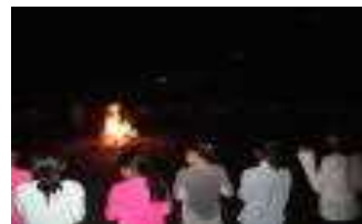
心に残ったキャンプファイヤー