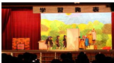
3年「ブレーメンの音楽たい」

10月6日(木)に、3・4年生の学習発表会が行われました。2学期が始まったところから調べ学習を行ったり、発表方法などを考えたり、衣装や道具、背景などを準備したりと、一生懸命に練習に取り組んできました。3・4年生ともに大きな声ではっきりセリフを言い、元気よく歌を歌いました。