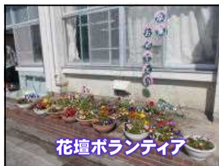
花壇ボランティア